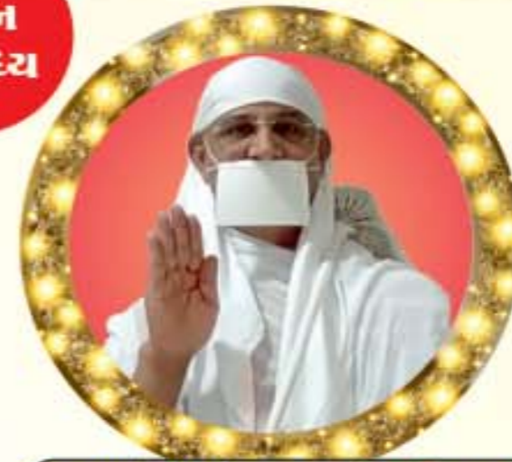
વ્યસનમુક્તિ પ્રણેતા પ.પૂ. નરેશમુનિ મ.સા.