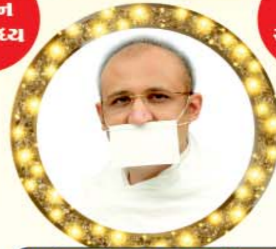
રાજસંત યુગદિવાકર પ.પૂ. નરમુનિ મ.સા.