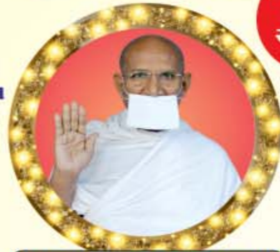
પ.પૂ.આ.ભ. ભાવચંદ્રજી મ.સા.